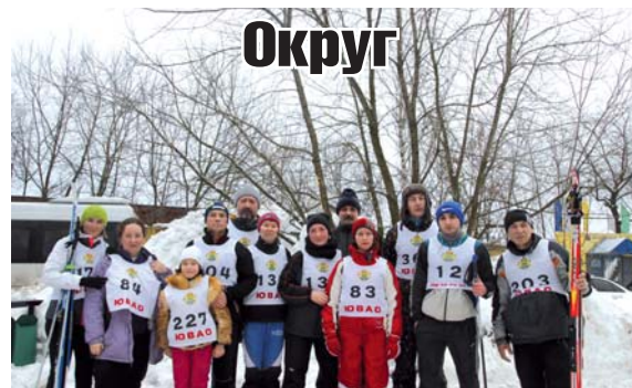
что лыжные забеги выходного дня в нашем районе проходят не зря!

Спортсмены Капотни с достоинством выступили на данных соревнованиях, еще раз доказав,